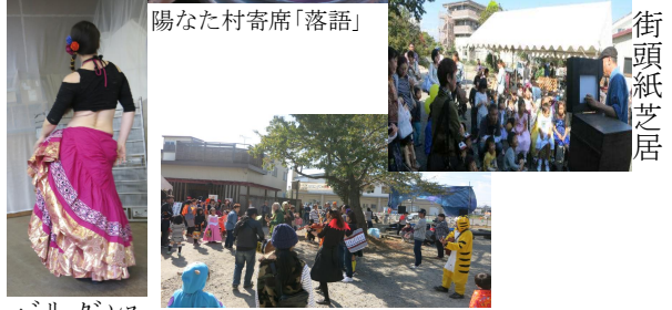
陽なた村寄席「落語」 そば打ち体験 街頭紙芝居 広場でのオープン演奏